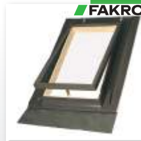
Даховий вилаз FAKRO WGI (46×55)