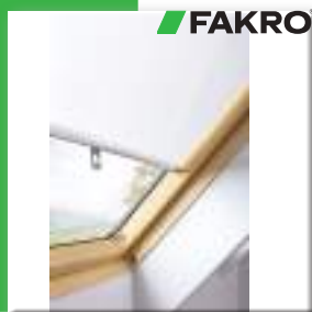
Внутрішня штора ARS I 07 колір 002