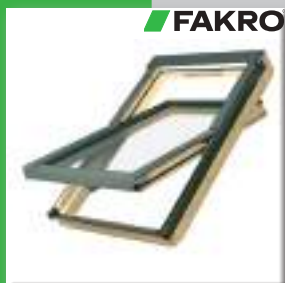
вікно FAKRO FTZ-U2 06