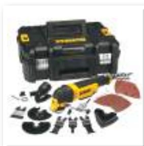
Інструмент багато- функціональний