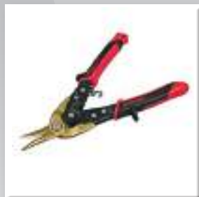
Ножиці по металу