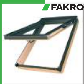
вікно FAKRO FPP-V preSelect 06