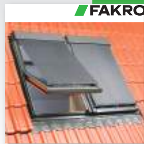
Зовнішня маркіза AMZ 06