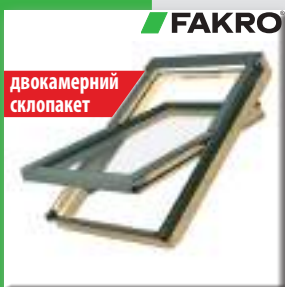
вікно FAKRO FTS-V U4 06