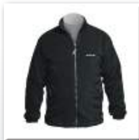
Флісовий светр FAKRO