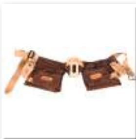
Монтажний пояс FAKRO